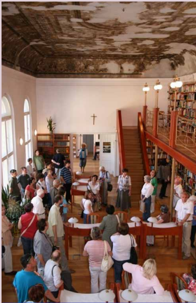
A Pécsi Püspöki Hittudományi Főiskola Könyvtára 2011-ben az Egyházi Könyvtárak Egyesülete pécsi közgyűlésén 2