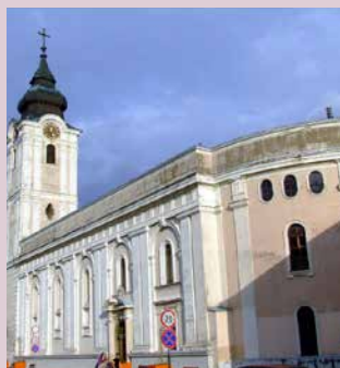
Boda Zsuzsa szeretett bibliotékái 1–2/ A Pécsi Egyetemi Könyvtár Szepesy Ignác utca 1. és 3. számú épülete, 3/ a Pécsi Püspöki Hittudományi Főiskola Könyvtára a régi Szeminárium épületében, 4/ a Pécsi Egyházmegyei Könyvtár első épülete a Ferences templomban

Boda Zsuzsa mindent, ami egyáltalán lehetséges volt, megtett azért, hogy hasznosuljon a nehezen megközelíthető állomány. 2001 nyarától általa folyamatosan napirenden volt a gyűjtemény méltó és a használhatóságát biztosító épületbe költöztetésének ügye, esetleges összeolvasztása a főiskolai könyvtárral. Addig is az olvasói igényeket figyelembe véve a társbibliotéka II. vatikáni zsinat utáni állományát helyben használatos különgyűjteményi letétként áthelyezte a főiskola könyvtárába.